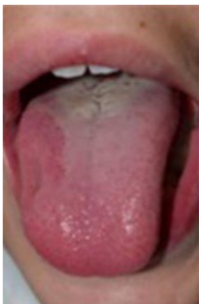
Fig. 2. Lengua Geográfica.