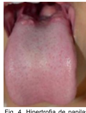
Fig. 4. Hipertrofia de papilas circunvaladas.