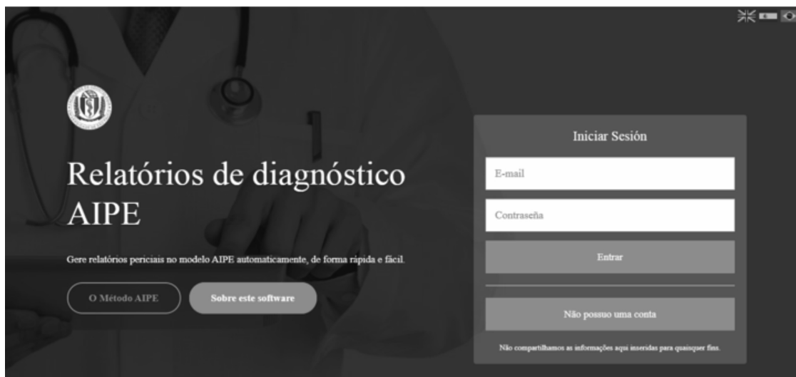
Fig. 2. Software AIPE.

La valoración del perjuicio estético, especialmente el causado por cicatrices en la zona facial, está sujeto a la subjetividad, tanto del evaluador como del afectado. A esto hay que sumar que el concepto de “estética” no es igual para todos y puede ir variando en función de la edad de la persona, su ocupación, sus relaciones sociales, entorno, etc. Si bien esta realidad es conocida por todos los profesionales forenses que evalúan cicatrices en esta zona del cuerpo, llama la atención la escasez de métodos estandarizados para